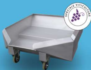
BENNE À DÉCUVER